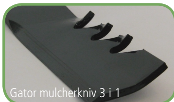
Gator mulcherkniv 3 i 1