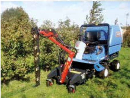
HK Termit 1300 på Iseki