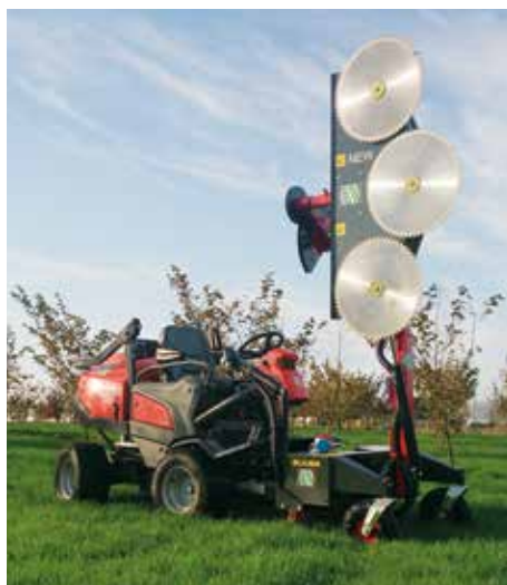
Termit + HS1300