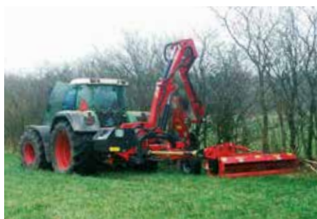
HK Max + HS 2300 + SK 2500