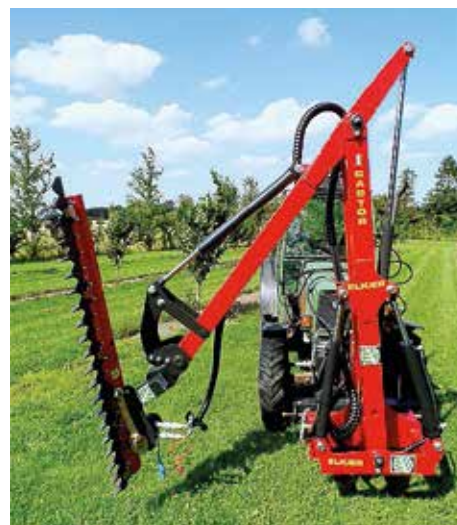
HK Pro + HK 1500-5