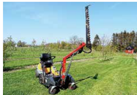
Termit + HK 1300-3