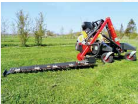
HK Termit 1300 på Stiga Park Pro