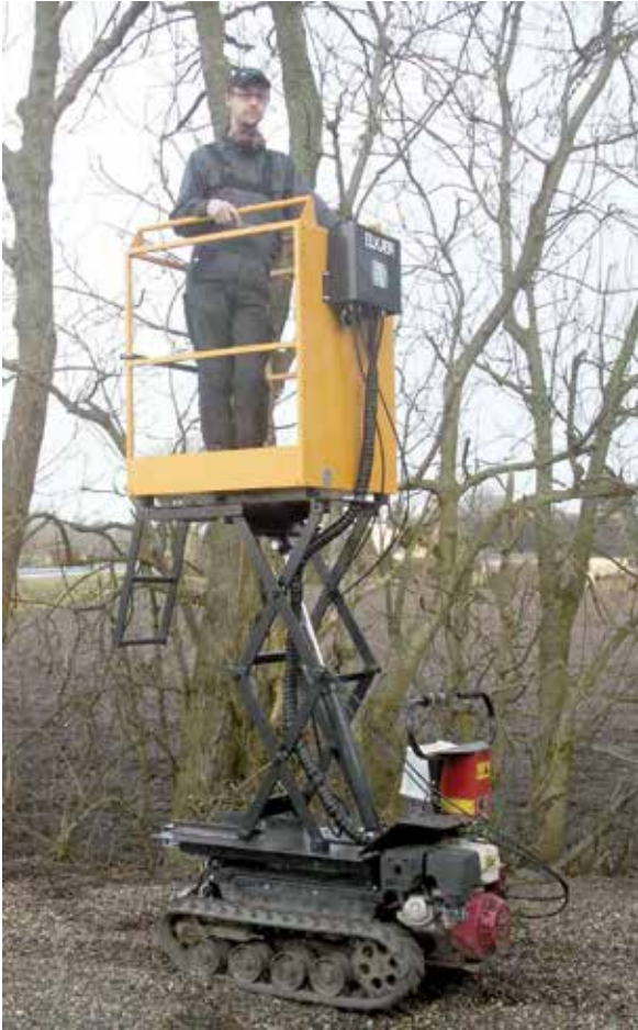
KL 600 Lift • Lifting platform • Hebebühne • Elévateur