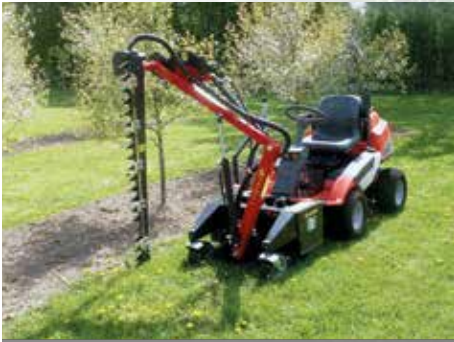
HK Termit 1300 på Husqvarna