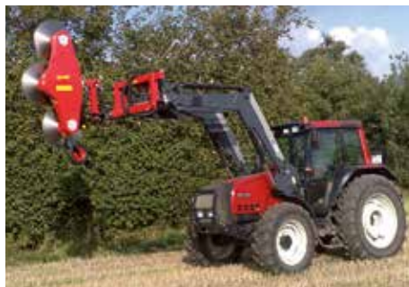
HKL-EX + HS 2300