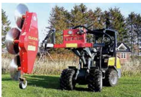
HKL Mini + HS 1750