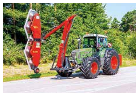
HK Pro-X + HS 3800