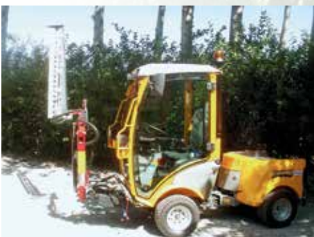
HK Termit 1300 på Stiga Titan