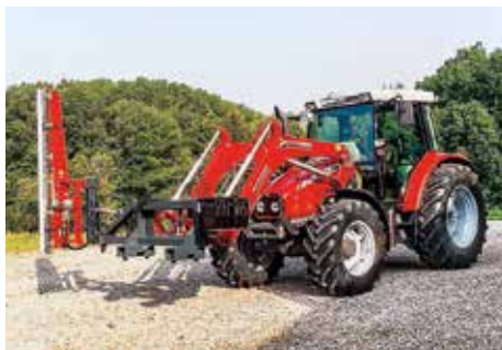
HKL Standard + HK 2000-5